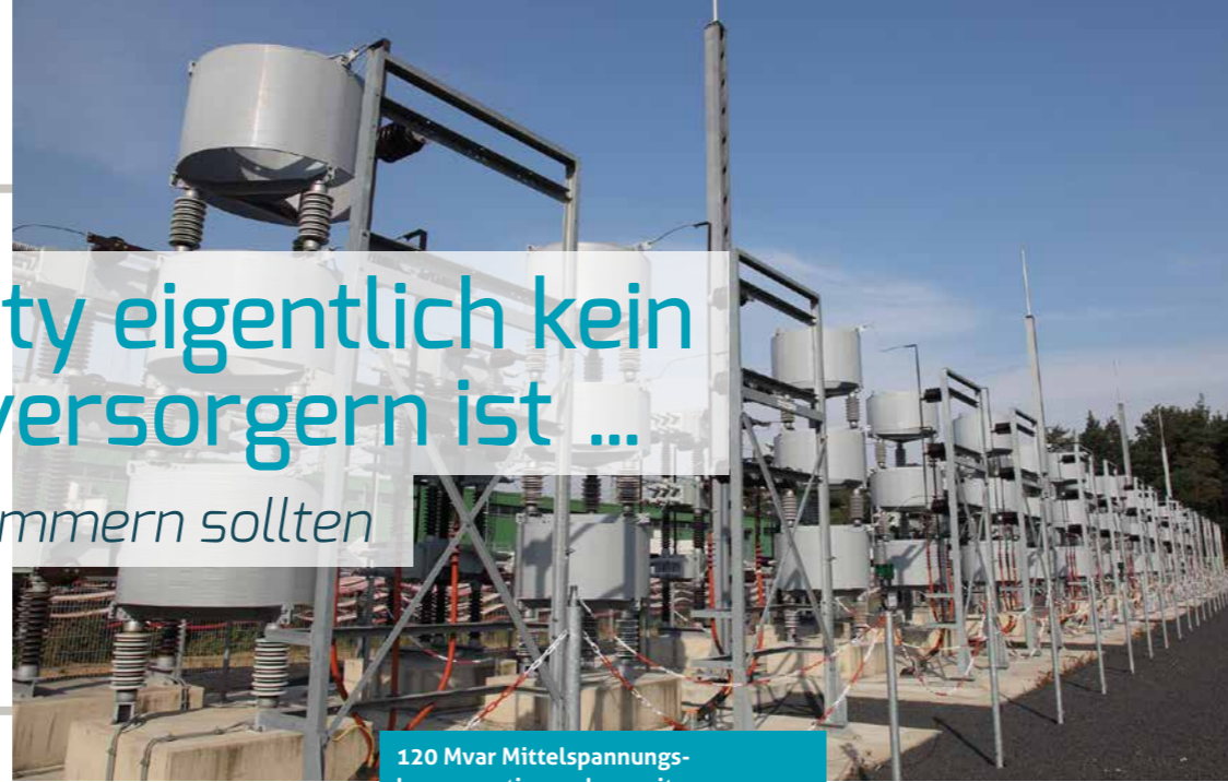
120 Mvar Mittelspannungskompensationsanlage mit bedämpfender Resonanzstufe.

sie sich aber trotzdem darum kümmern sollten